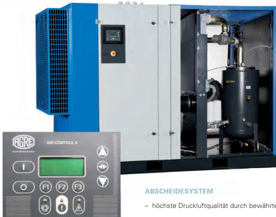
Air Control 4